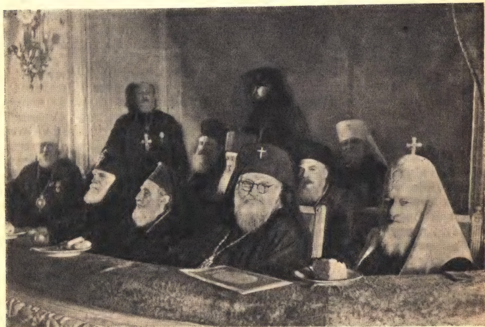
Святейшие Патриархи и представители православных церквей в ложе во время духовного концерта

В наступившем антракте одни восторженно делились своими впечатлениями от исполнения хора и солистов, другие хранили благоговейное и сосредоточенное молчание, как бы боясь расплескать в разговорах полную чашу драгоценных переживаний этого памятного вечера.